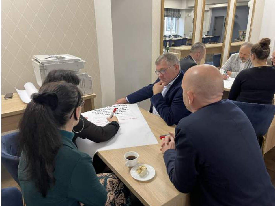
Zdjęcia z warsztatów konsultacyjnych 1 marca 2023 roku